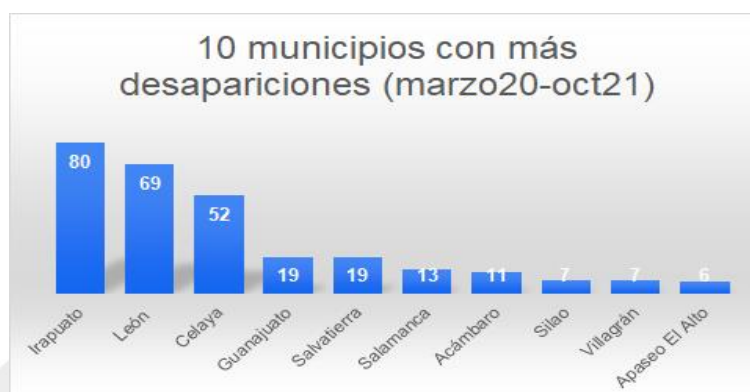
Imagen 4. Principales 10 municipios de procedencia de personas desaparecidas en los que se han elaborado alertas por la cuenta @desapgto.

En cuanto a las personas desaparecidas menores de edad, hay un total de 124, lo que representa el 34.7% de las alertas, de las cuales, las mujeres desaparecidas son 66 menores de edad lo que se traduce en el 40.9% y en el caso de los hombres se presentan 39 registros lo que implica el 20%.