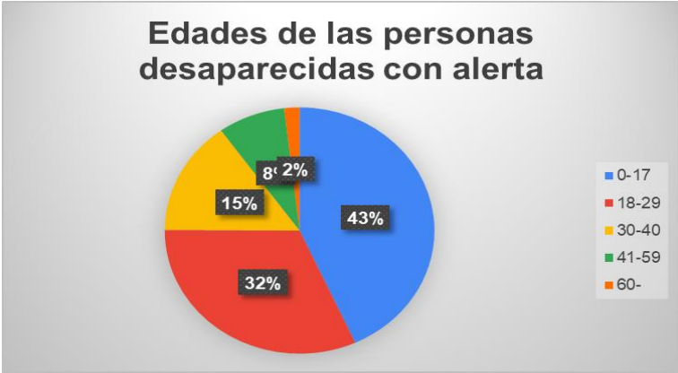
Imagen 3. Edades de las alertas elaboradas en porcentajes.

En cuanto a los datos registrados por edad de desaparición, es necesario mencionar que en la base de datos del sitio @DesapGto, sólo se cuenta con este registro en el 70% de los casos, por lo que el análisis de esta información está calculada en base a los 281 casos reportados con la edad de la persona desaparecida; de acuerdo a lo anterior, se observa es que las edades de desaparición en el caso de los hombres muestra el pico mayor en 17 años que representa el 6.8% (12 hombres), mientras que, en el caso de las mujeres se muestran 3 registros significativos a los 16 años representando el 12% de las desapariciones (18 mujeres); 15 años con el 9.5% (14 mujeres) y 13 años, 8.8% (13 mujeres); el resto de las desapariciones van desde los 4 meses de edad hasta los 81 años con una dispersión que va de 1 a 18 eventos, como en los casos que anteriormente se reportan.