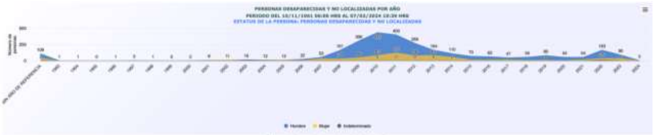
Imagen 2. Personas desaparecidas y no localizadas, en Coahuila, por año.

Si bien, se ha mencionado que a nivel nacional la mayor cantidad de casos de desaparición se han registrado a partir de la llamada guerra contra el narcotráfico , también es posible identificar que, particularmente en el caso del Estado de Coahuila, se replica el aumento en los registros en dicha época.