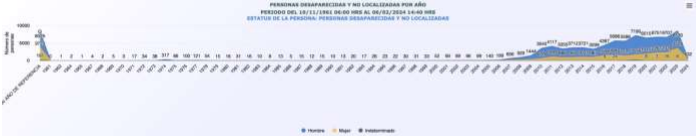
Imagen 1. Personas desaparecidas y no localizadas, en México, por año.

Registro Nacional de Personas Desaparecidas y No Localizadas, 5 se han documentado la mayor cantidad de casos de desaparición.